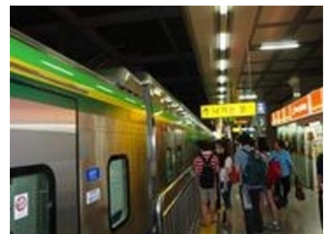
TX2階建車両、韓国ではここにしかありません

AM9:00 ホテル出発、ソウル駅のロッテマートで買い物。ソウル駅で明日の春 川までの ITX の 2 階指定券を買う。明洞ロッテ免税店で買い物。梨泰院(イテ オン)散策。世界の台所通りにて、本にある場所を見つける。昼はイタリアンレ