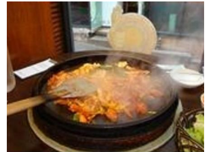
春川名物 タ・カルビ