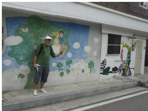
駱山公園の壁アート

大学路(テハンノ)迄、地下鉄で行 き、ソウルのモンマルトルと言われ る、駱山公園(ナクサン)に行く。ソ ウル城郭を見ながら東大門まで、 壁アートを見ながら歩いて行く。東 大門 dotta にてショッピング。夕食 は、市庁近くの五福亭(オボクジョ ン)にてサムギョプサルでマッコリ をたらふくいただく。(45,000won) ホテルに戻り、ウイスキーを飲み即ダウンする。1日目より充分な観光でした。