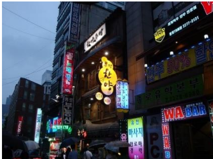
居酒屋、ハングルのみ 看板はソウルの音名らしい

からない。隣のテーブルに若いカップルが居て、英語での会話と手振りでなんとか注文をする。居酒屋なので、お酒のアテしかなかったが、これが結構うまかった。マッコリ(トントンジュ)が美味しく、気持ちよく酔っ払いました。ホテルに戻り、この日も即ダウンでした。