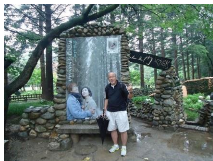
冬のソナタにどっぷり