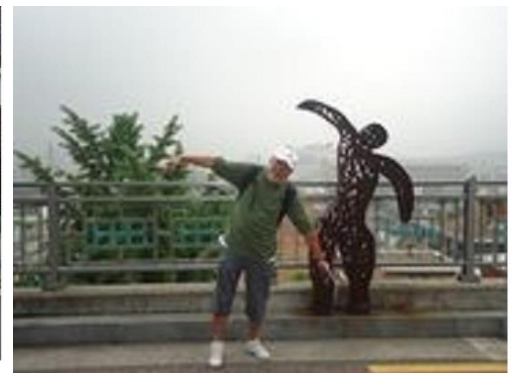
東大門のアート・ペイント