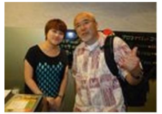
明洞マッサージの受付嬢と

からない。隣のテーブルに若いカップルが居て、英語での会話と手振りでなんとか注文をする。居酒屋なので、お酒のアテしかなかったが、これが結構うまかった。マッコリ(トントンジュ)が美味しく、気持ちよく酔っ払いました。ホテルに戻り、この日も即ダウンでした。