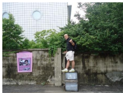
ユジンとチュンサンが乗り越えた高校の壁