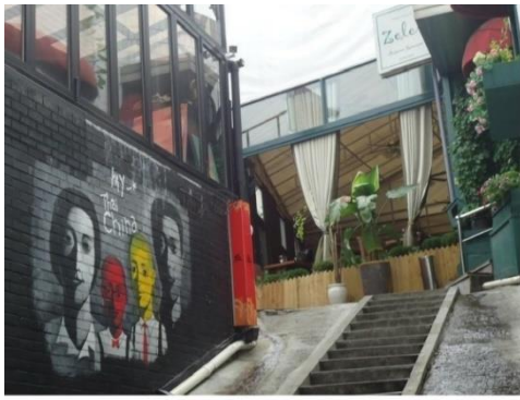
梨泰院、世界の台所通りのアート