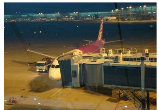
今回お世話になったLCCのPEACH

PEACH のキャンペーン片道 2,980 円にまんまと嵌められた結果になりました。今回の費用、安いと思われるか？高いと思われるか？意見は分かれますと思いますが、衝動旅はやはり考えものです。航空運賃は確かに安いですが、トータルはあまり変わるものではないと感じました。安い分、買物が増えるか？食べ物・飲み物が増えるのです。仕掛け人の思惑にまんまと乗せられているわけです。経済効果が上がるきっかけになる事を思い、次回からの旅を又考えます。