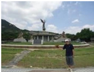
青瓦台をバックに

ま、付岩洞近辺を散策する。北側から見たソウル市内を堪能する。景福宮まで、途中青瓦台の前を通り、ウォーキングする。次回再度行く価値があります。昼を土俗村のサムゲタンと考えておりましたが、店の前は長蛇の列、40分位ですよといわれたが、止めました。明洞へ行き、高峰レストランでサムゲタンと海鮮チジミを戴きました。